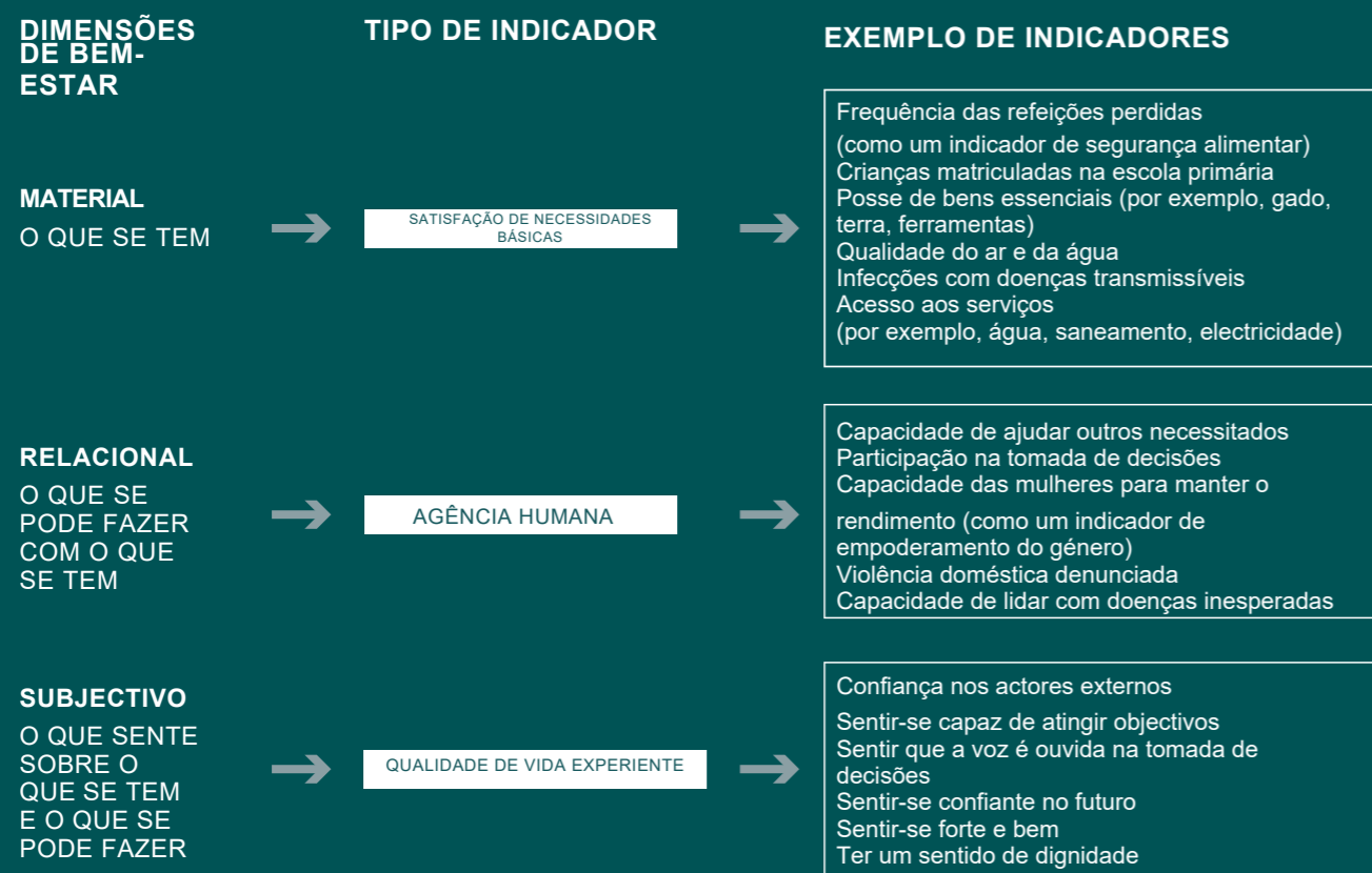
Figura 3: Como diferentes indicadores de bem-estar mapeiam as diferentes dimensões do bem-estar. Os indicadores de exemplo são para mostrar que tipos de indicadores se relacionam com que dimensão; os indicadores reais serão específicos para cada caso e devem ser desenvolvidos de forma participativa.